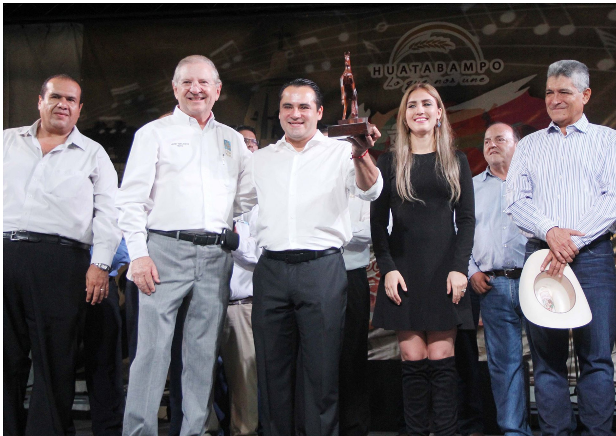
Nota y fotografía: Coordinación de Comunicación Institucional

Además se ofrecerán servicios a niñas, niños, jóvenes y adultos de la colonia Lázaro Cárdenas, colonias aledañas y comunidades cercanas, con actividades como "Cuenta Cuentos", pláticas de orientación de acuerdo al diagnóstico comunitario, apoyo psicológico familiar, escuela para padres, clases de baile, entre otras.