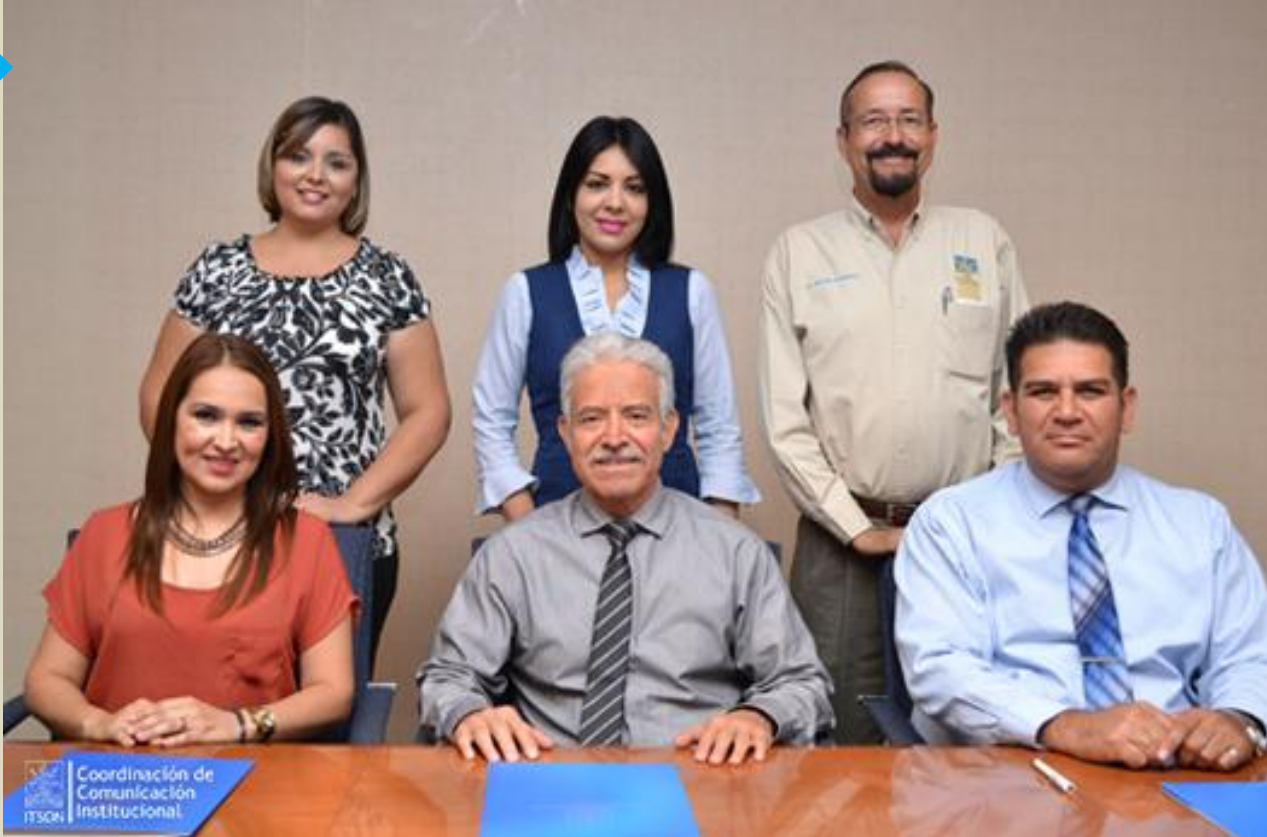
Nota y fotografía: Coordinación de Comunicación Institucional