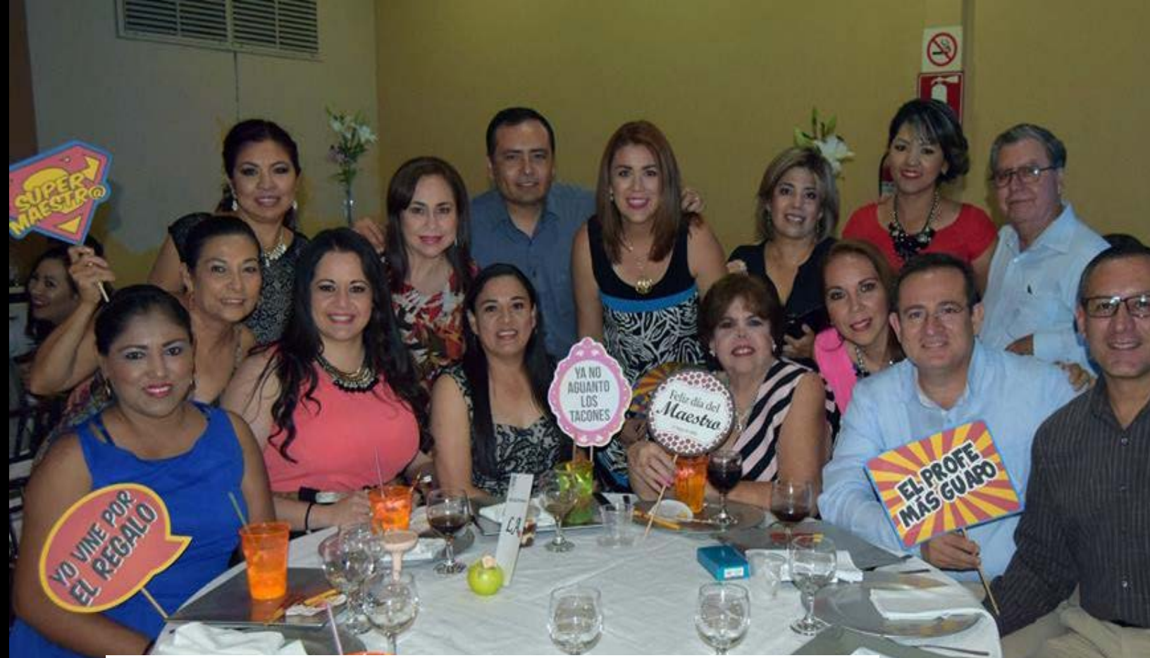
Maestros y Maestras de Licenciado en Administración y Contaduría Pública

E l Instituto Tecnológico de Sonora, Unidad Navojoa, llevó a cabo la celebración del Día del Maestro 2016, con la finalidad de reconocer el esfuerzo, la dedicación, las buenas prácticas y sobre todo, el orgullo de ser docente de la Institución.