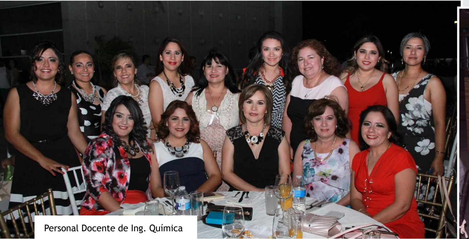
Personal Docente de Ing. Química