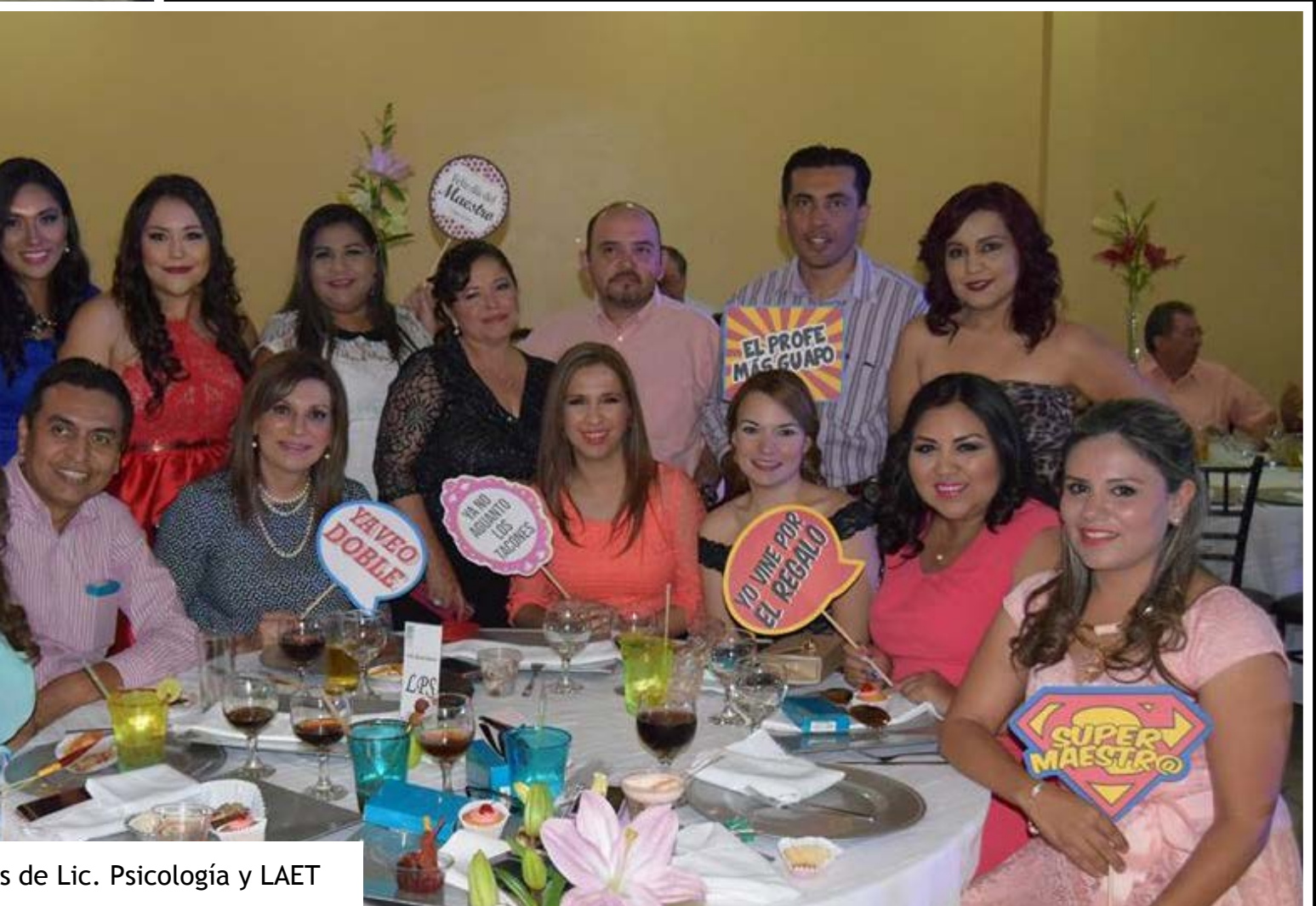
s de Lic. Psicología y LAET