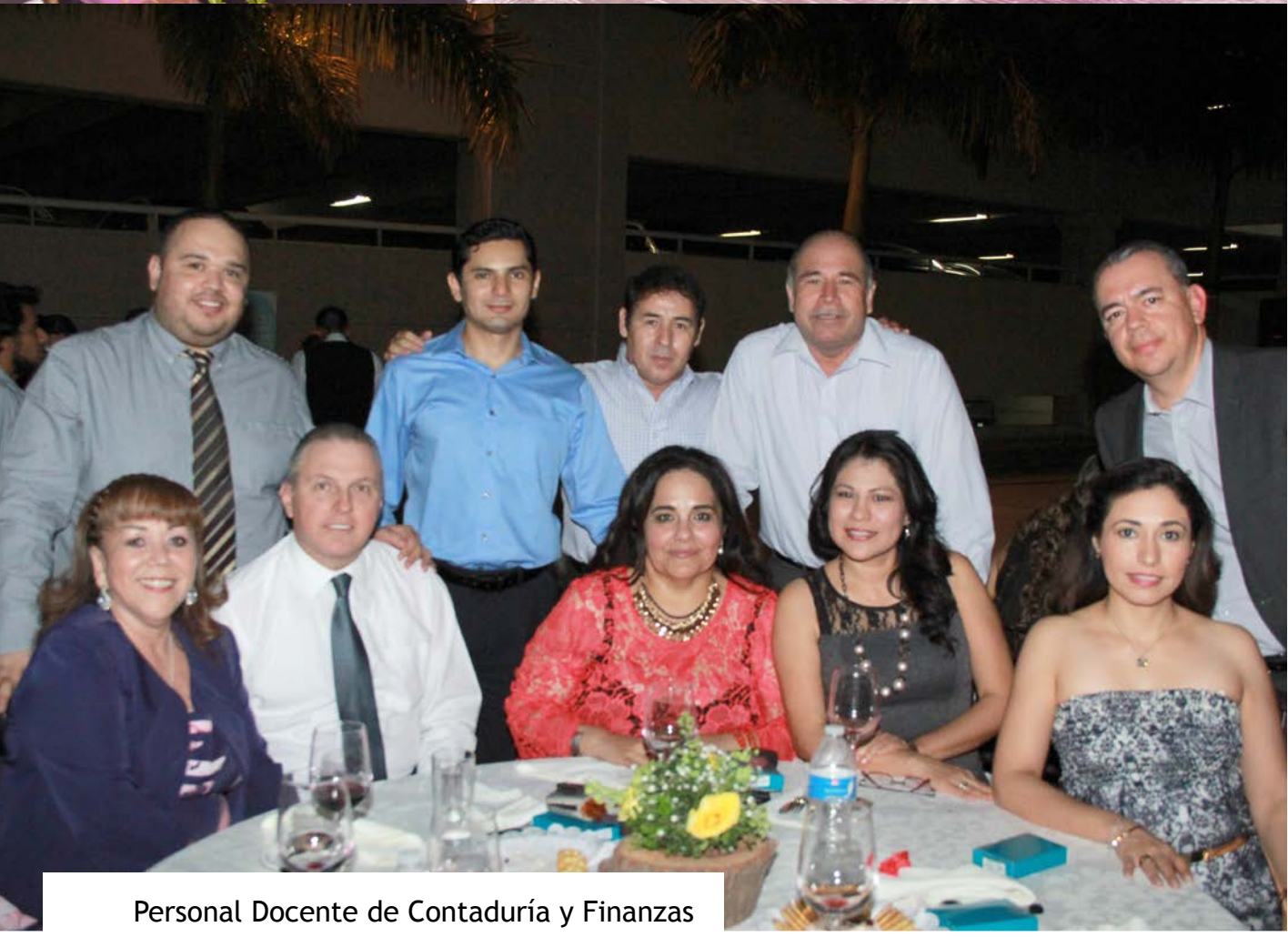
Personal Docente de Contaduría y Finanzas