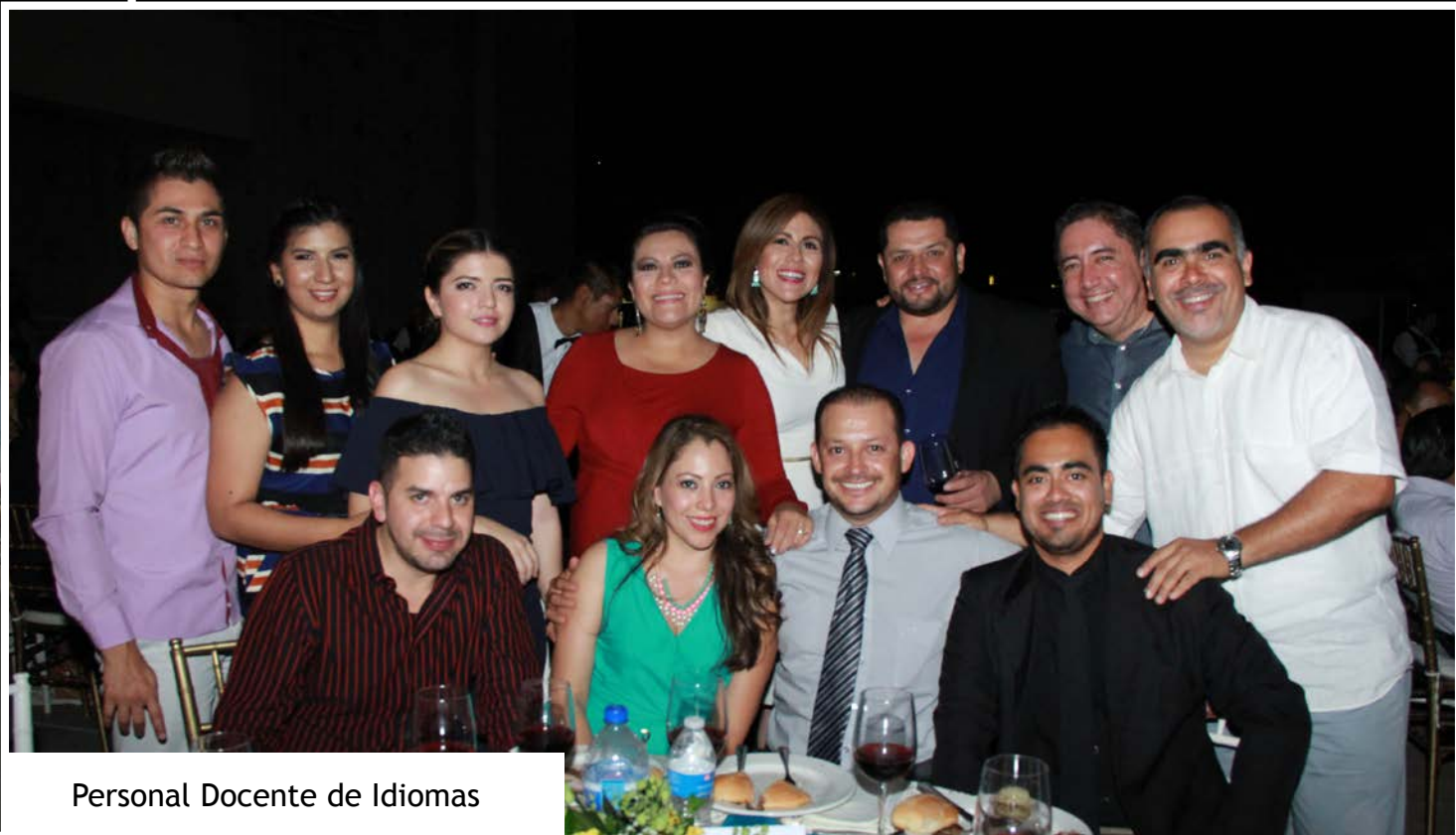
Personal Docente de Idiomas