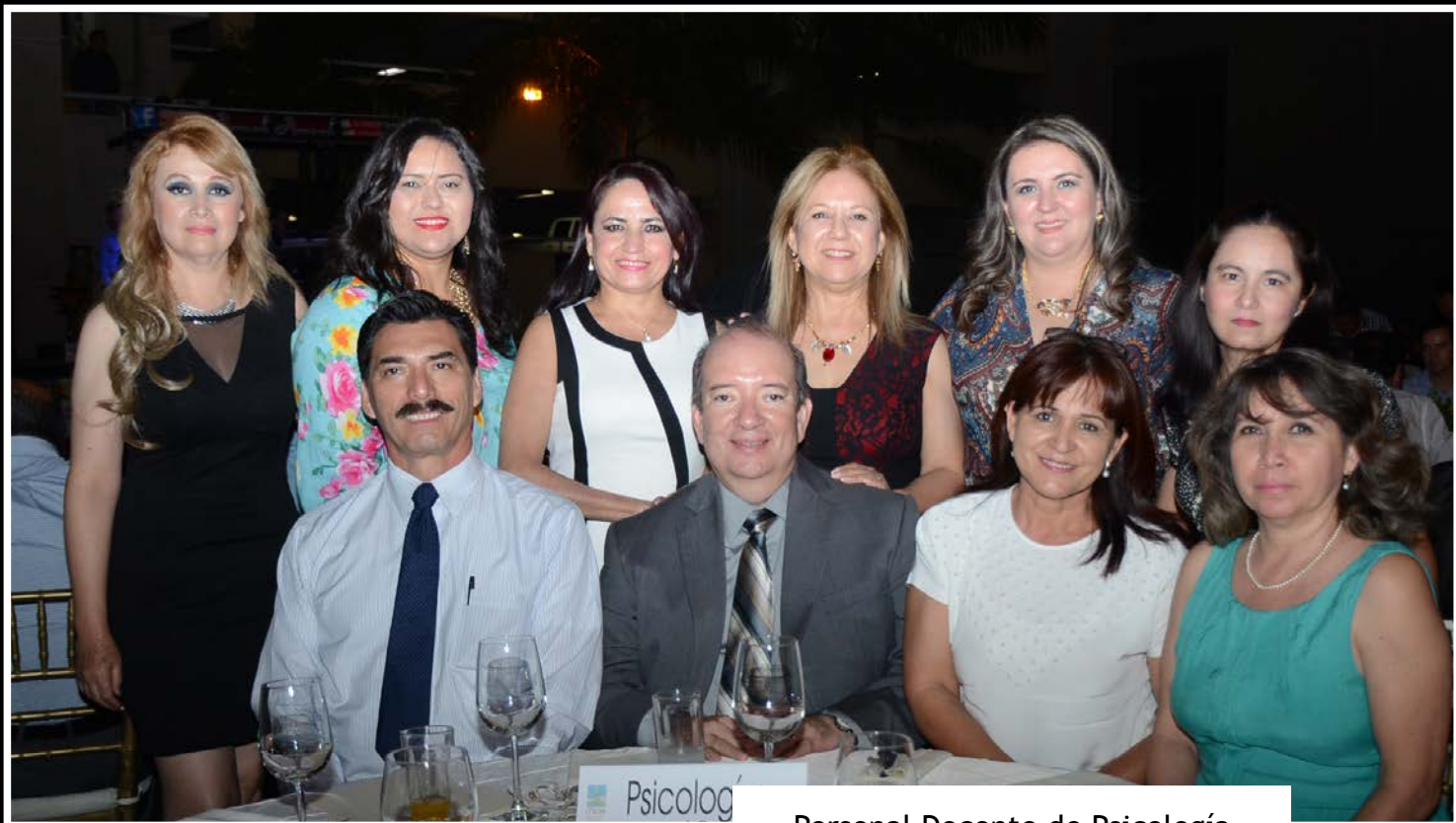
Personal Docente de Psicología