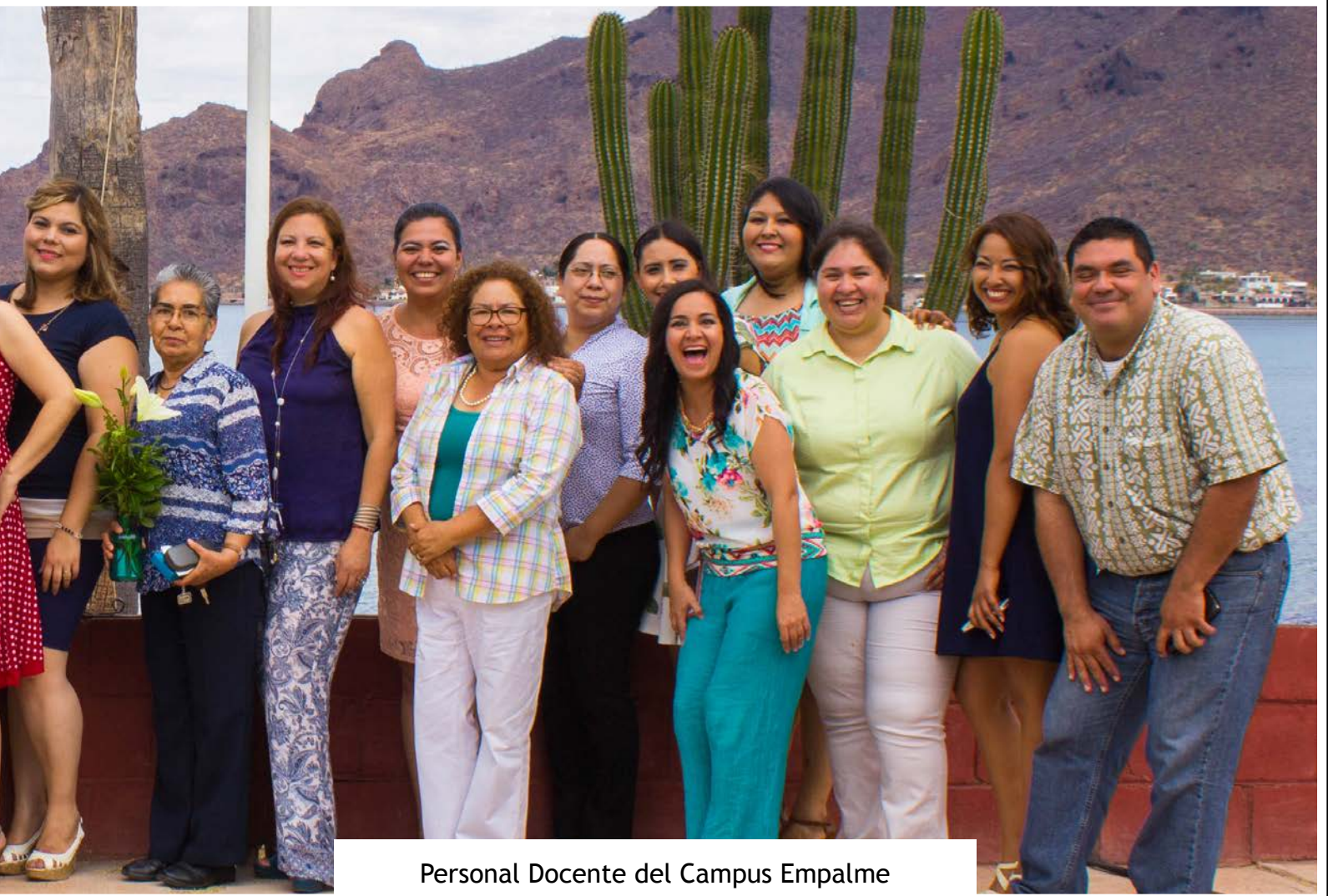
Personal Docente del Campus Empalme