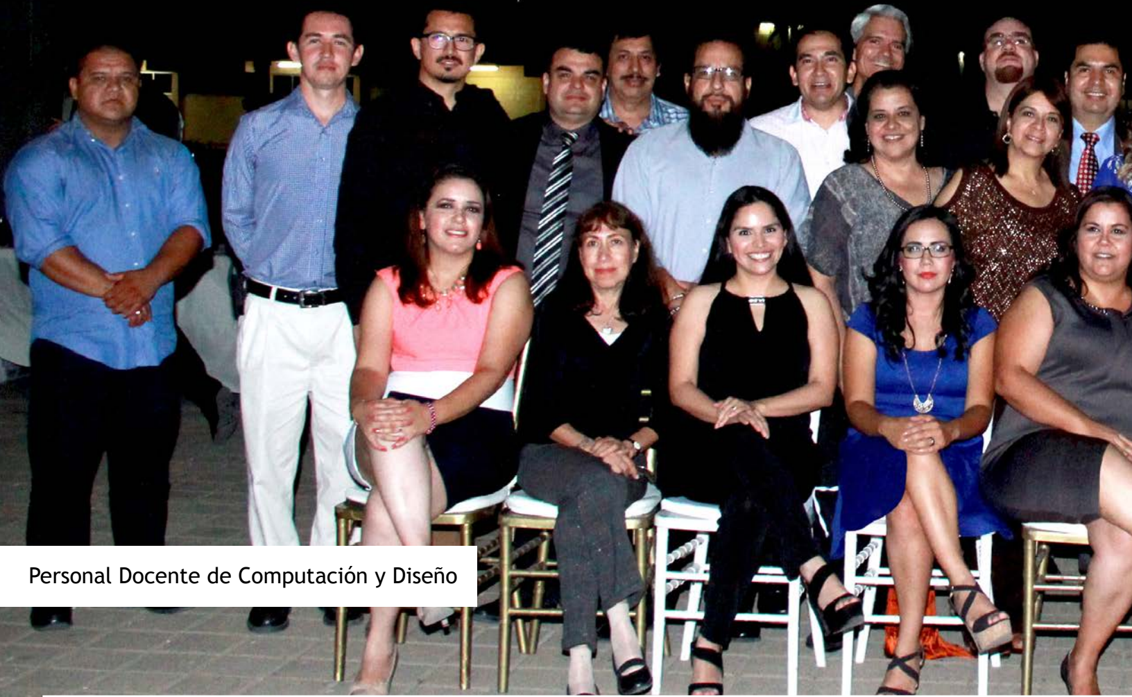
Personal Docente de Computación y Diseño