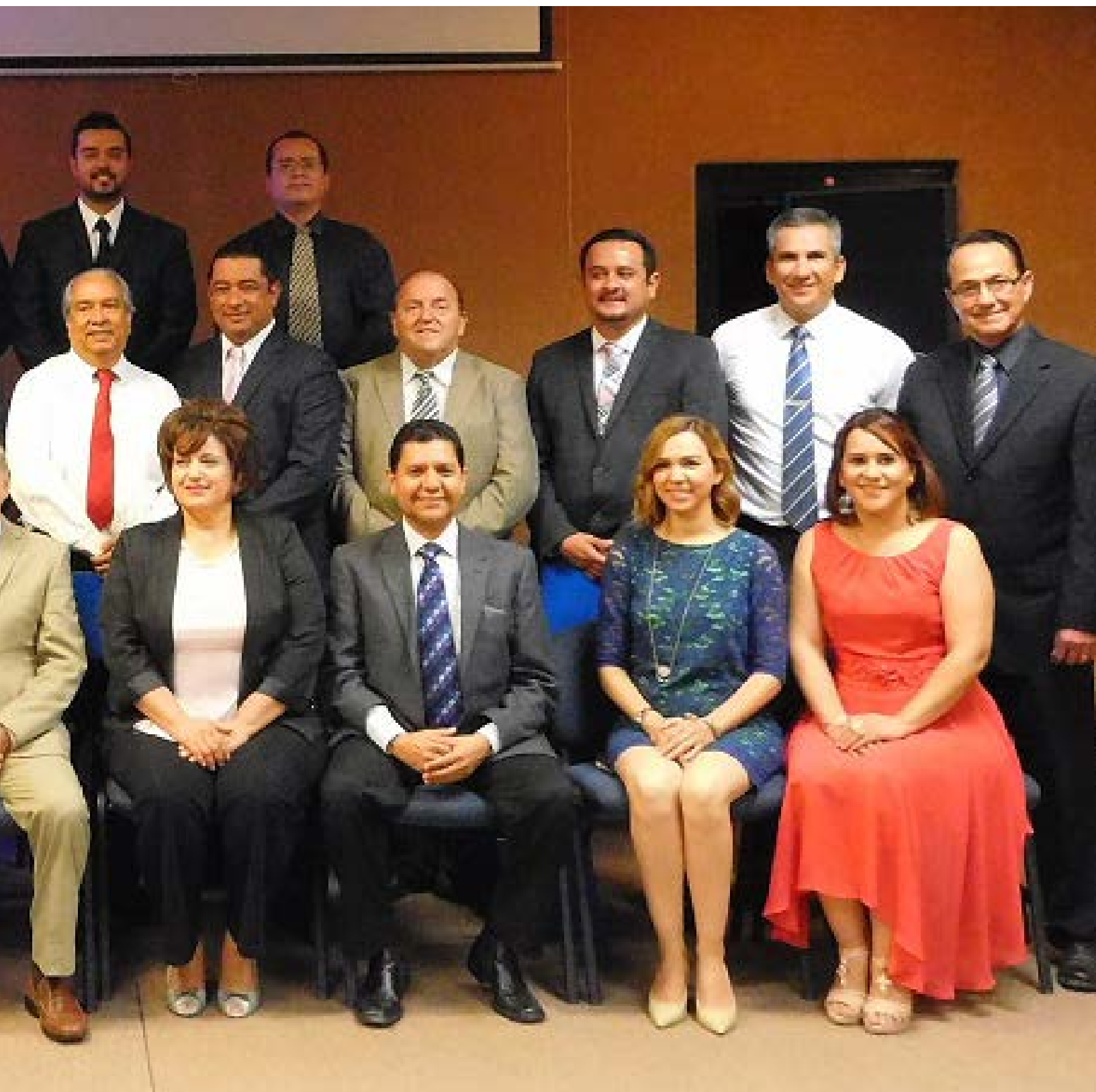
Maestros Distinguidos Unidad Navojoa