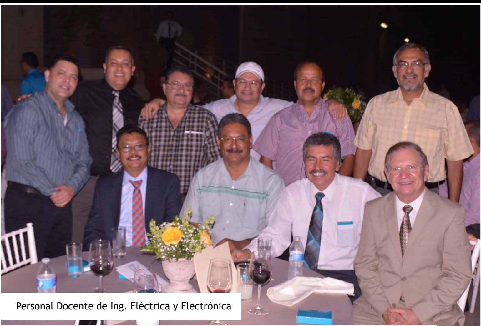
Personal Docente de Ing. Eléctrica y Electrónica