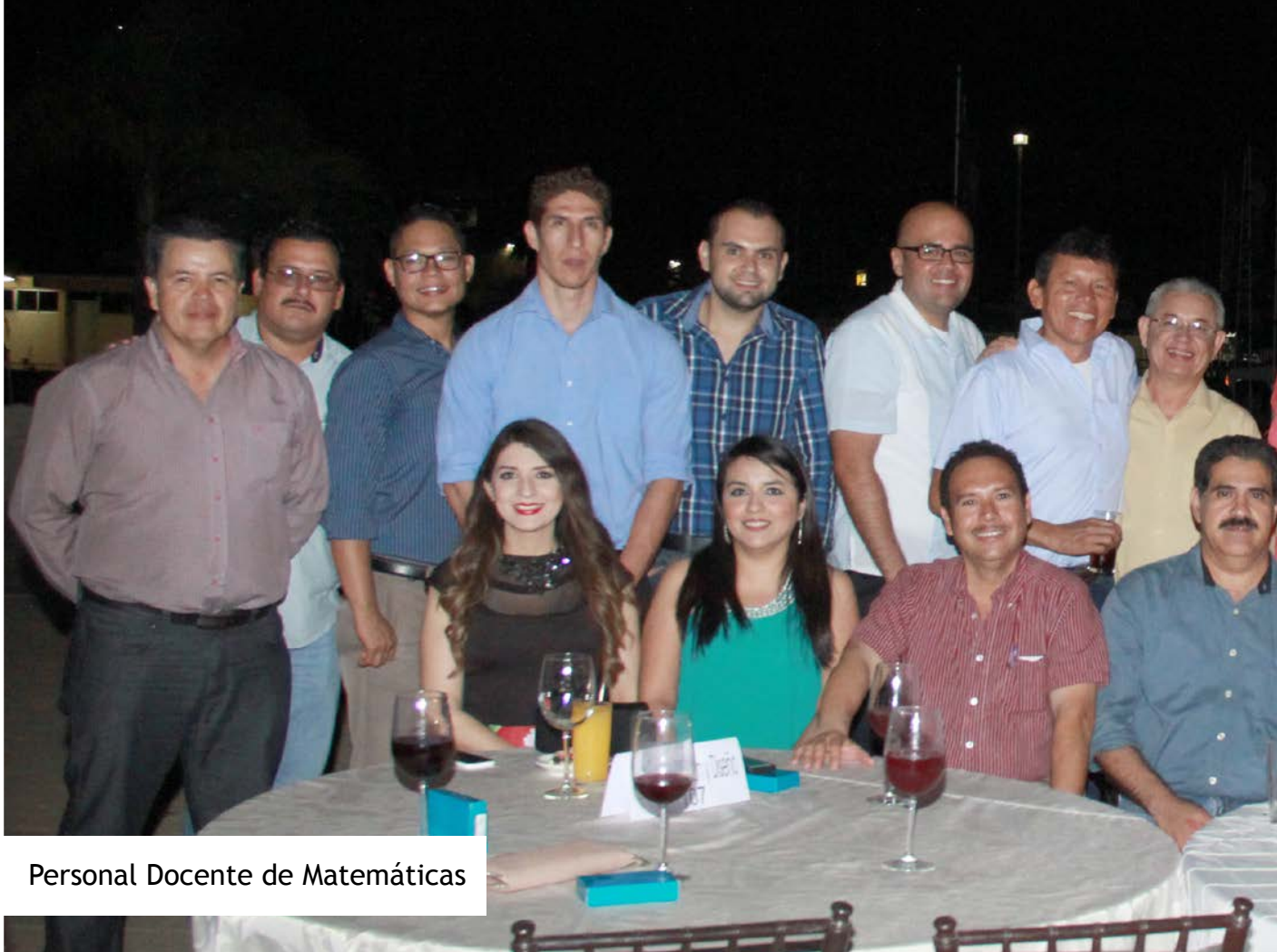
Personal Docente de Matemáticas