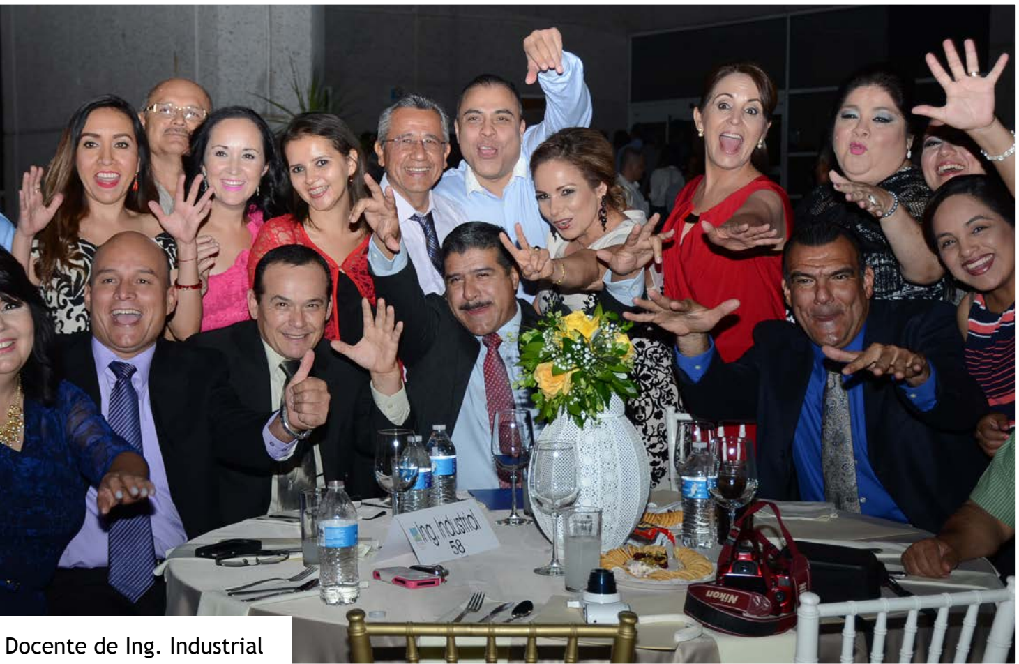
Docente de Ing. Industrial