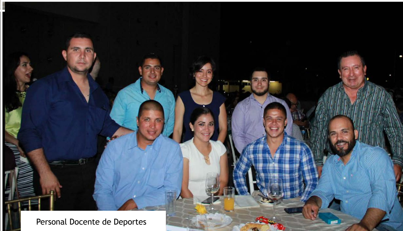
Personal Docente de Deportes