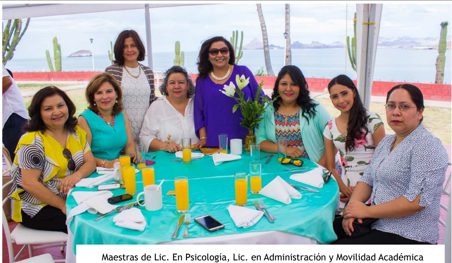
Maestras de Lic. En Psicología, Lic. en Administración y Movilidad Académica