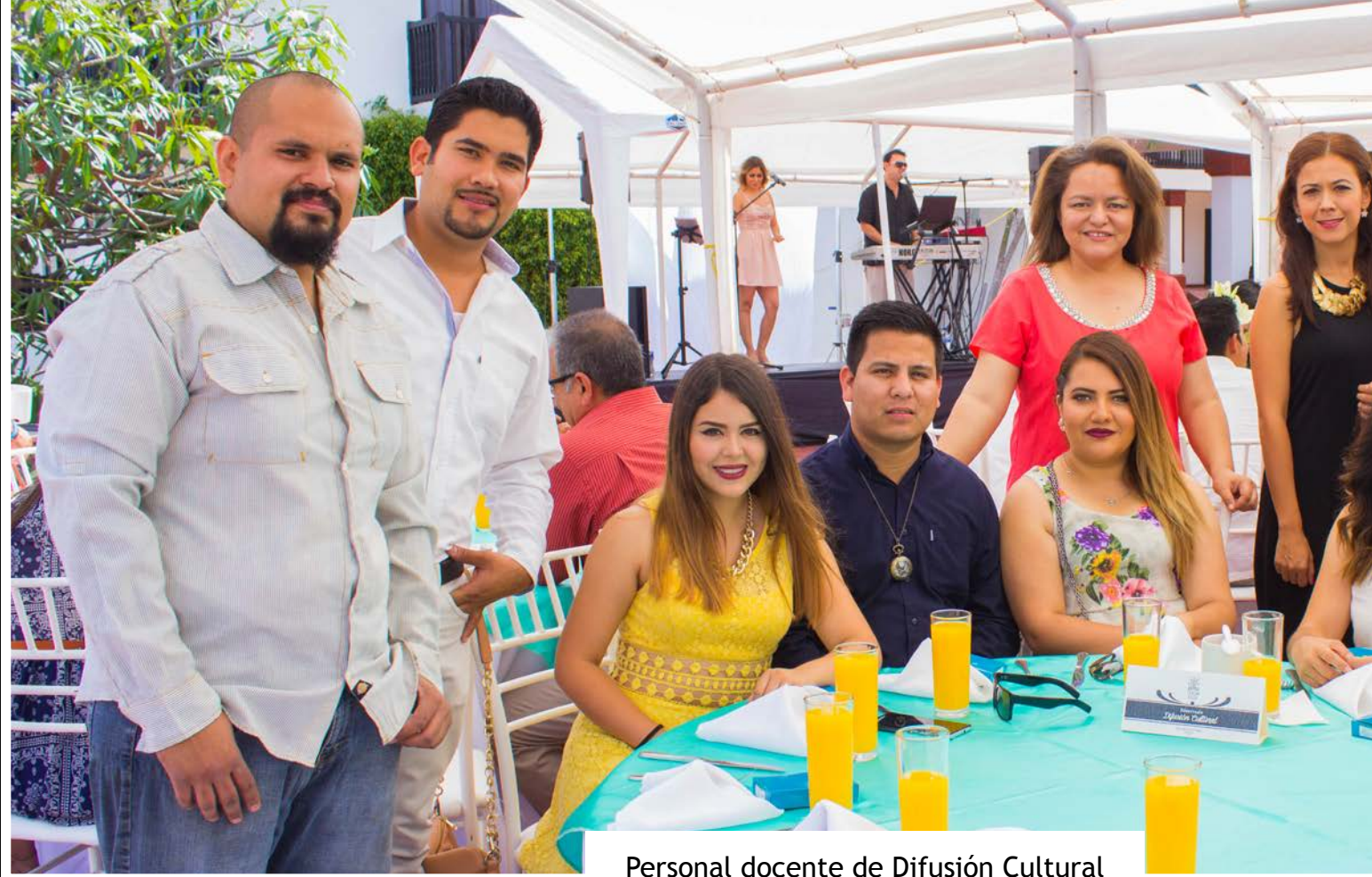
Personal docente de Difusión Cultural