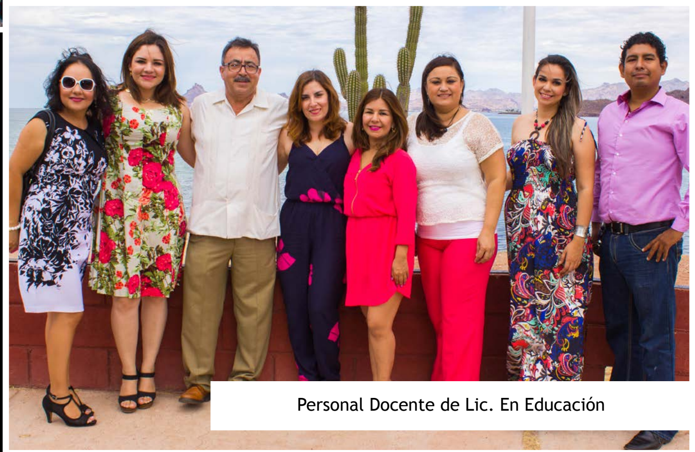
Personal Docente de Lic. En Educación