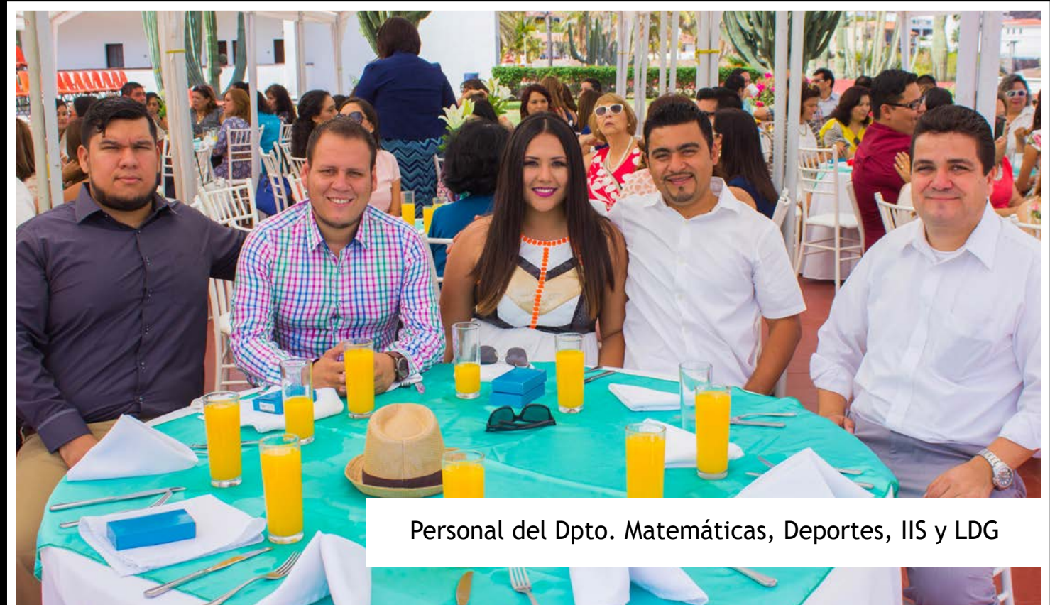
Personal del Dpto. Matemáticas, Deportes, IIS y LDG