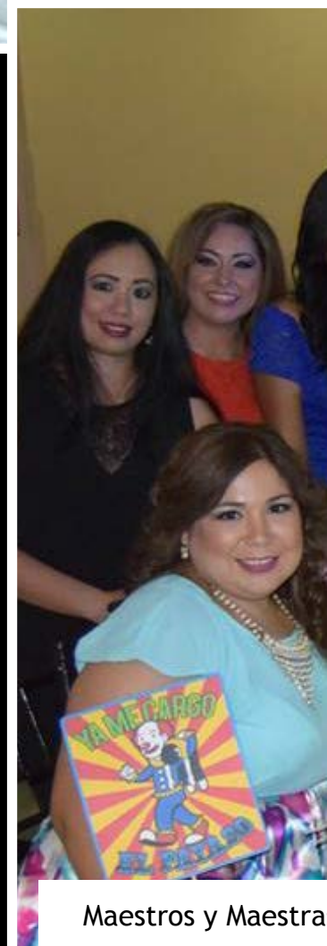
Maestros y Maestras

Asimismo se realizó la presentación de un grupo versátil de la localidad en la que maestros disfrutaron al ritmo de la música, baile, cena y rifa de regalos.