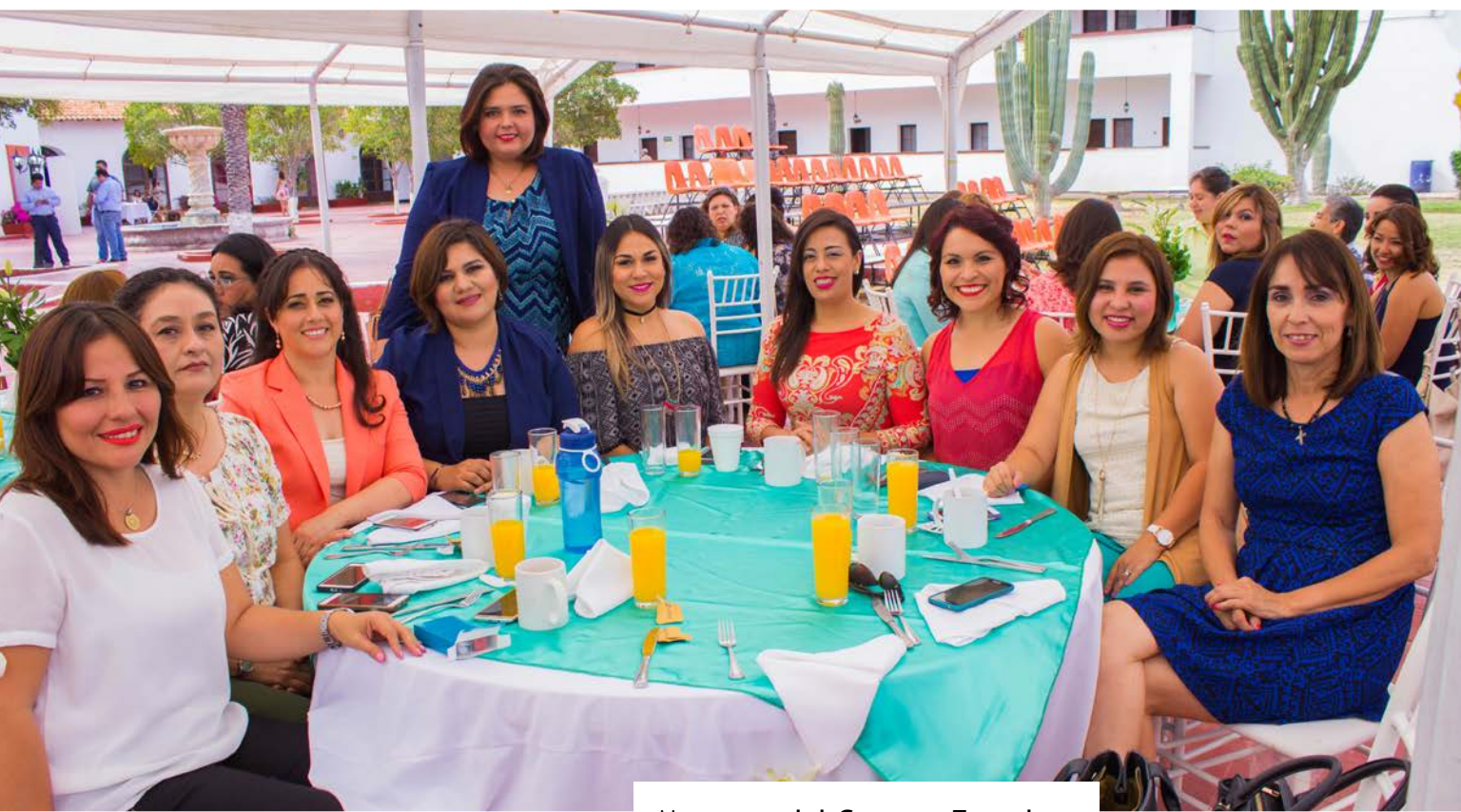
Maestras del Campus Empalme