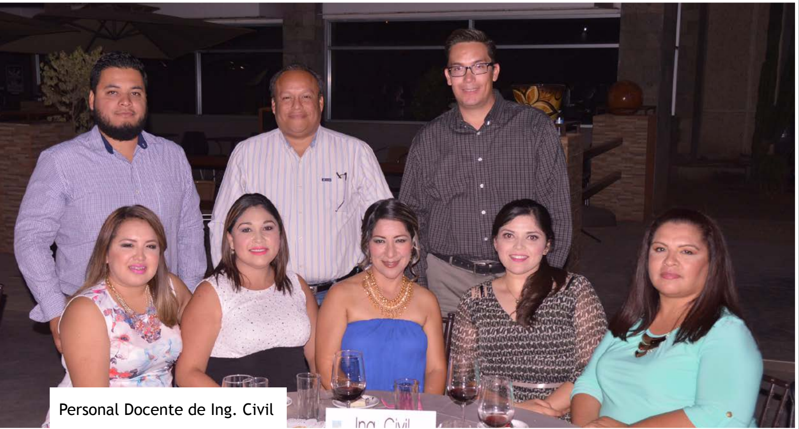
Personal Docente de Ing. Civil