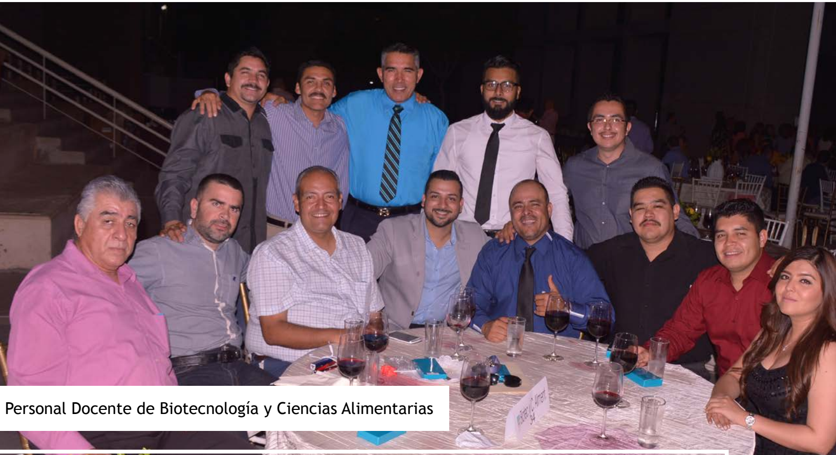
Personal Docente de Biotecnología y Ciencias Alimentarias