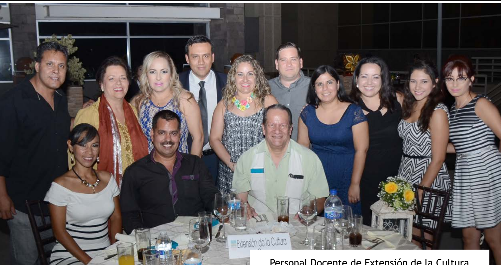
Personal Docente de Extensión de la Cultura