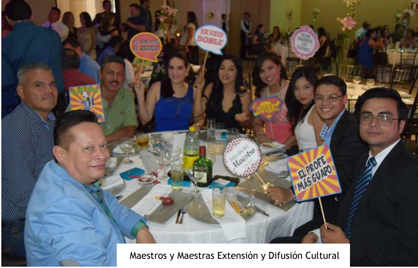
Maestros y Maestras Extensión y Difusión Cultural