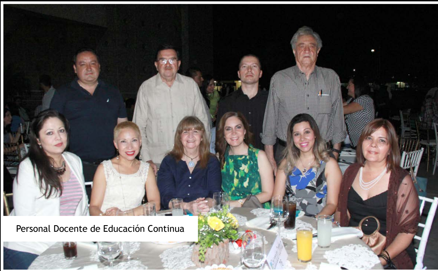
Personal Docente de Educación Continua