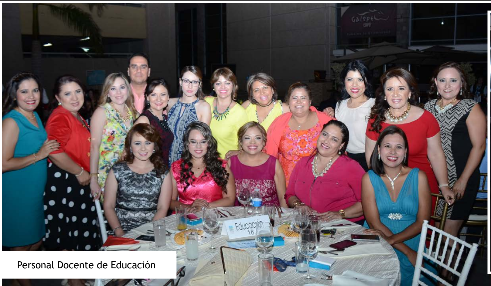
Personal Docente de Educación