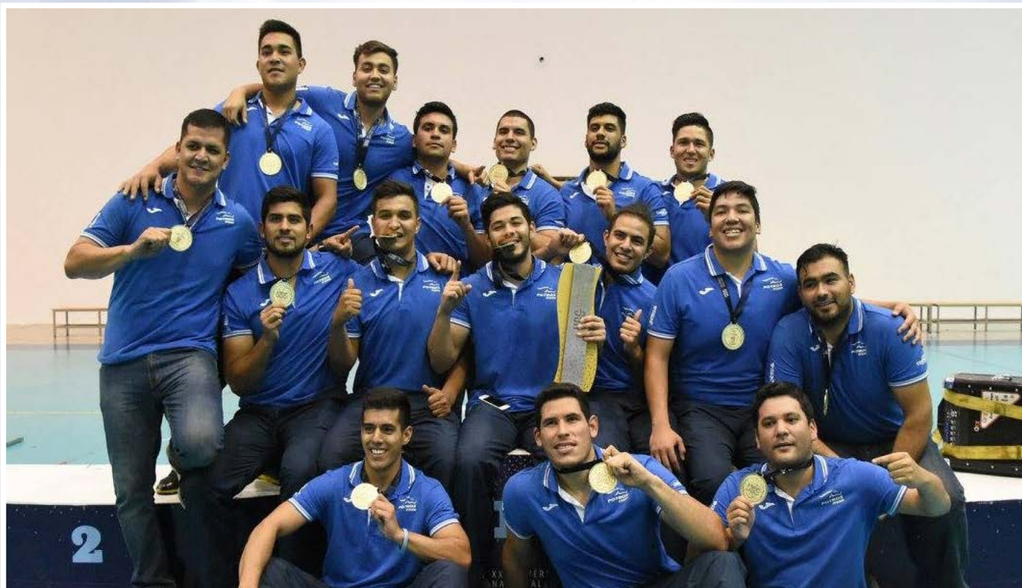
El equipo representativo de ITSON en Handball varonil se llevó de nuevo medalla de oro concluyendo el torneo de manera invicta.