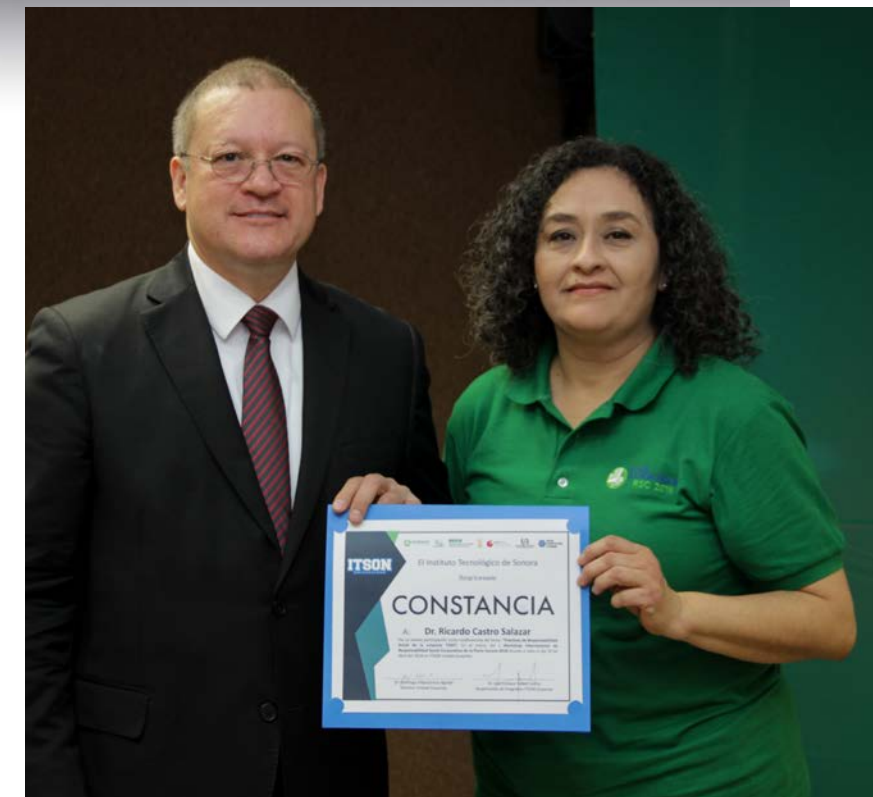
Publicado el 20/04/2018