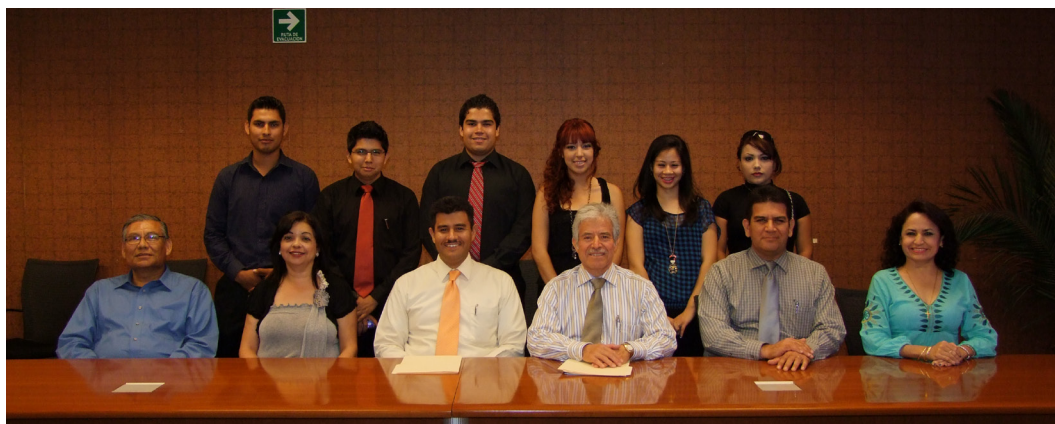
Sociedad de Alumnos de Licenciado en Psicología

Por último felicitó a los alumnos que cumplieron sus periodos al frente de las sociedades de alumnos y que en forma puntual presentaron resultados.