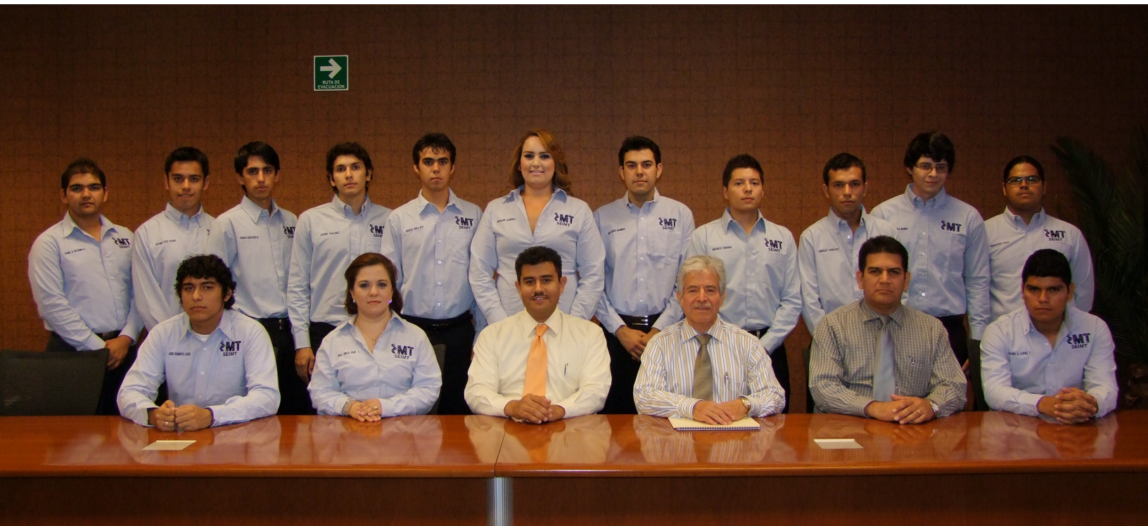
Sociedad de Alumnos de Ingeniería en Mecatrónica

E n ceremonias de toma de protesta realizadas con las nuevas sociedades de alumnos, el Rector invitó a los estudiantes a ejercer un liderazgo comprometido con la misión del ITSON.