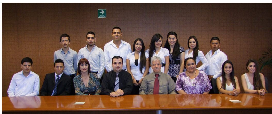
Sociedad de Alumnos de Licenciado en Contaduría Pública