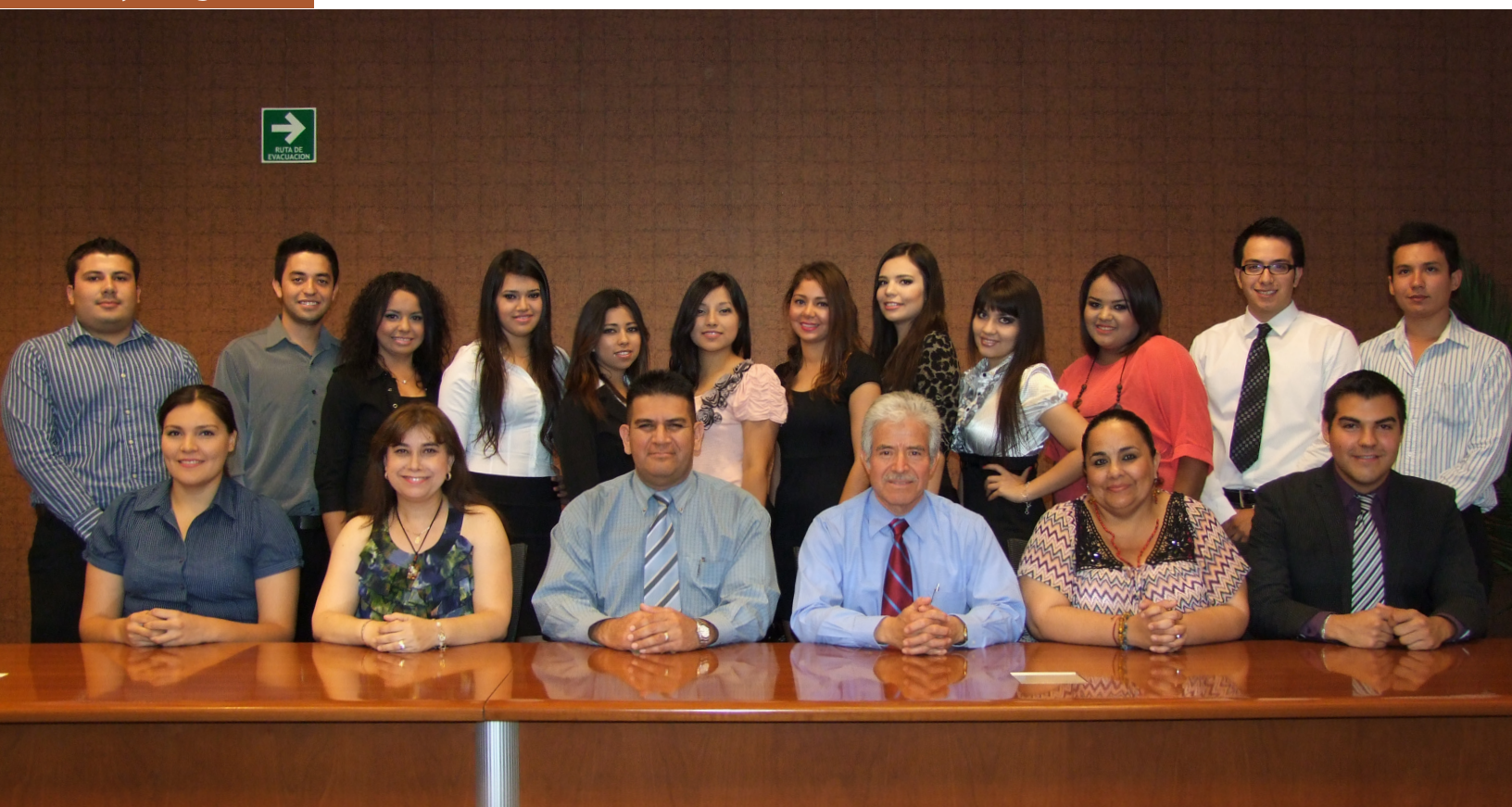
Sociedad de Alumnos de Licenciado en Economía y Finanzas

y que les permitirán un adecuado desempeño, tanto en lo personal, como en lo profesional.