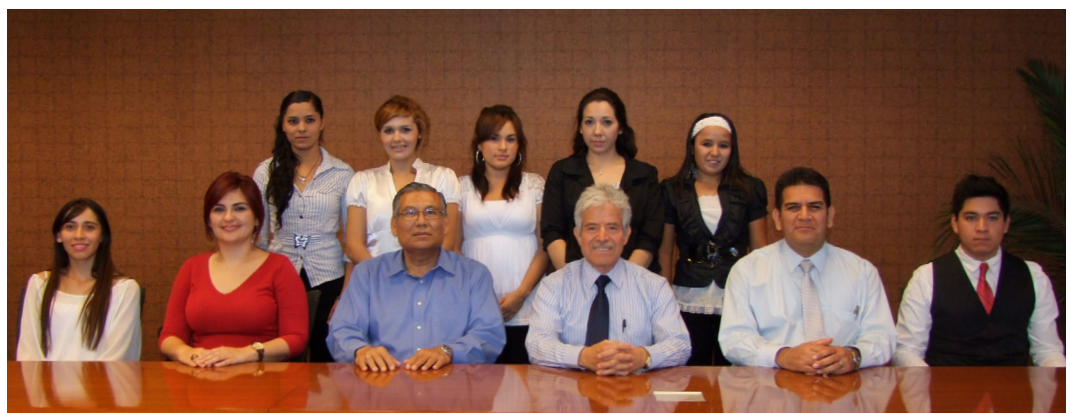
Sociedad de Alumnos de Licenciado en Ciencias de la Educación