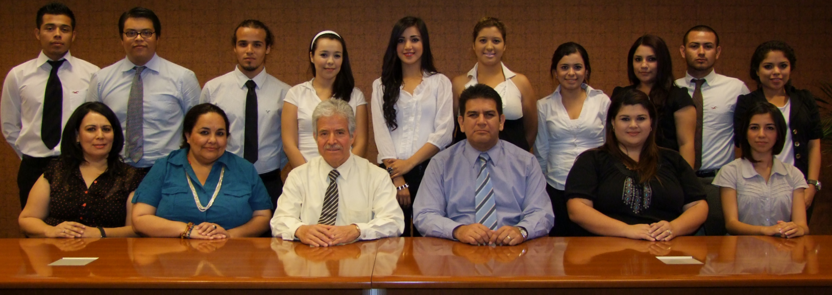
Sociedad de Alumnos de Licenciado en Administración de Empresas Turísticas

que como representantes estudiantiles ubiquen áreas de oportunidad en la Institución, para que a través de ustedes se reciban propuestas de la comunidad estudiantil, encaminadas a elevar la pertinencia en la educación que se imparte en los programas educativos”, dijo.