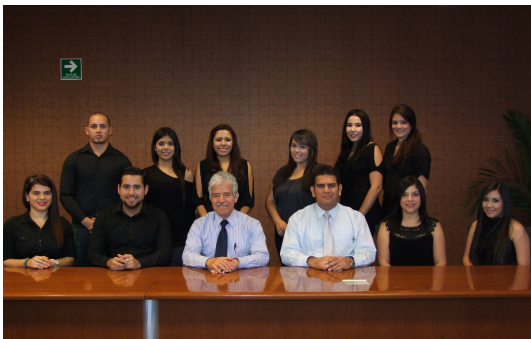
Sociedad de Alumnos de Licenciado en Tecnología de Alimentos