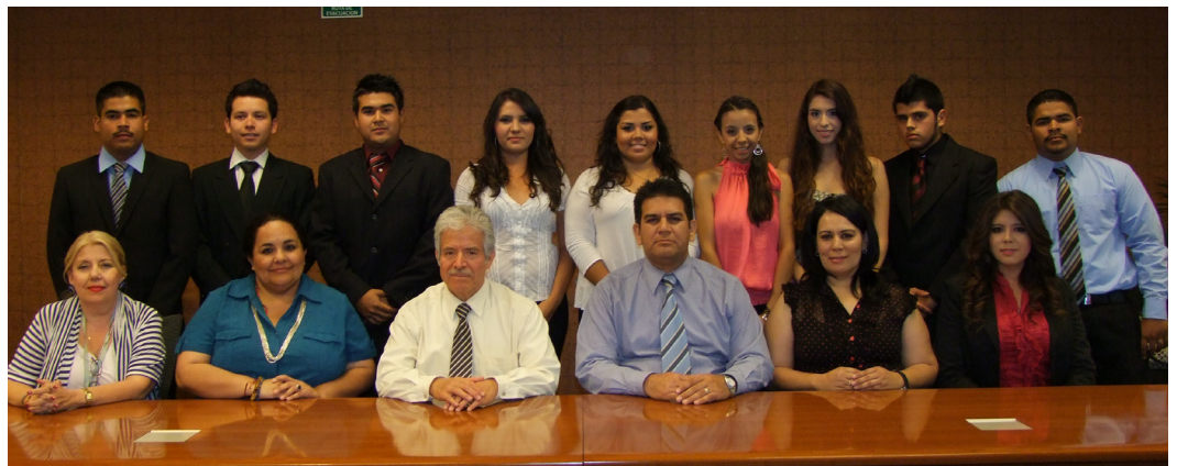
Sociedad de Alumnos de Licenciado en Administración