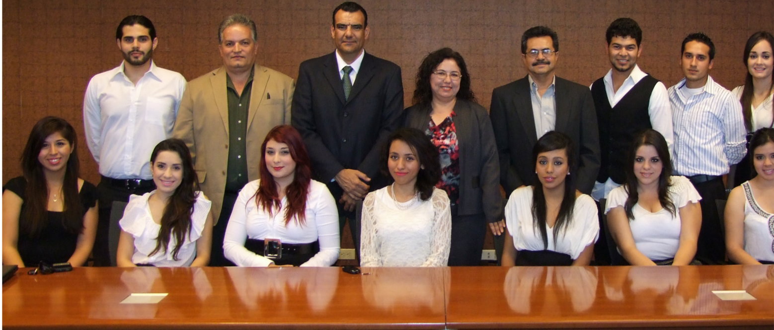
Sociedad de Alumnos de Ingeniería Química.