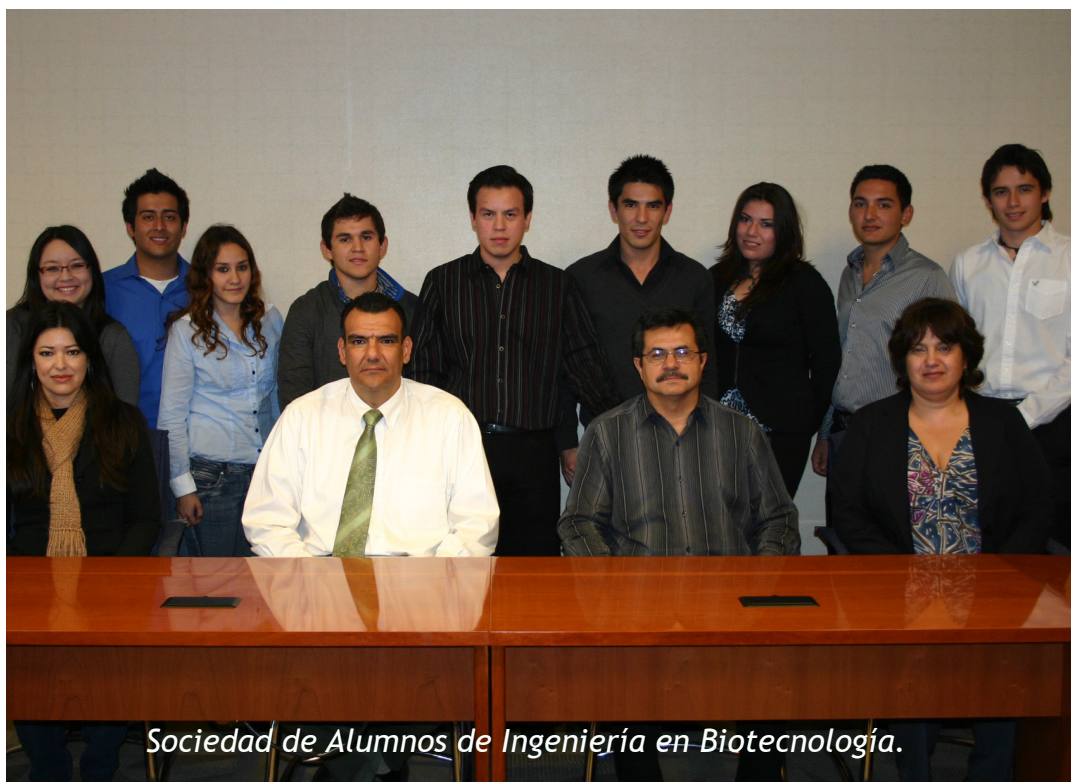
Sociedad de Alumnos de Ingeniería en Biotecnología.