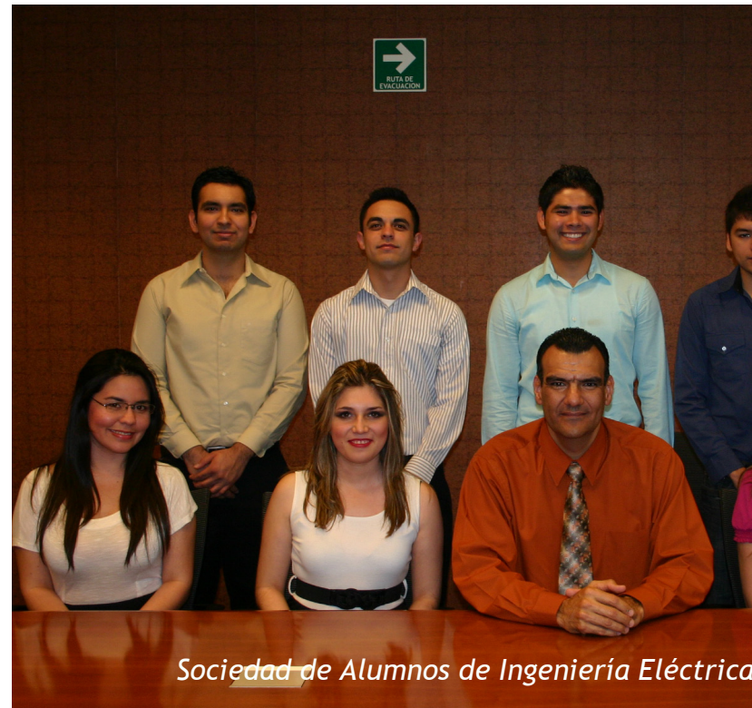
Sociedad de Alumnos de Ingeniería Eléctrica.