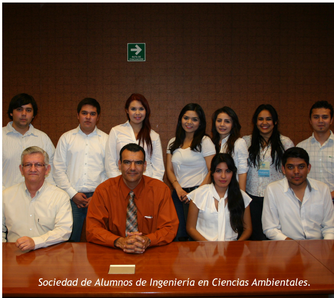
Sociedad de Alumnos de Ingeniería en Ciencias Ambientales.