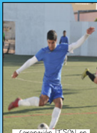
Coronación ITSON en Fútbol de Bardas