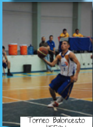
Torneo Baloncesto ITSON