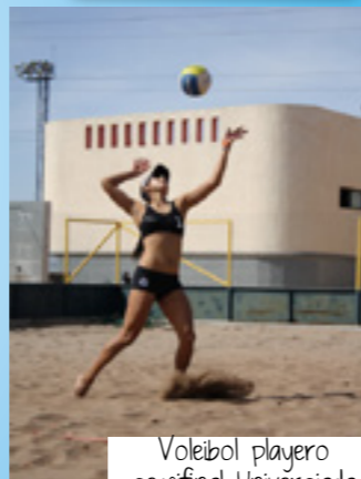
Voleibol playero semifinal Universiada Nacional 2012

La infraestructura deportiva está a la altura de las mejores universidades del mundo. Incluye una pista de atletismo con piso de tartán, la alberca mejor equipada del país para la realización de competencias de alta categoría, canchas de tenis donde se realizan torneos internacionales, canchas de fútbol y básquetbol a nivel profesional, campo de béisbol y, en general, todo lo necesario para la práctica de tu deporte favorito.